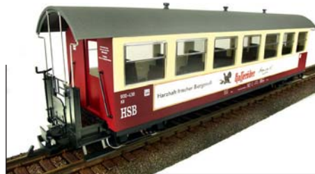
HSB Personenwagen 900-438