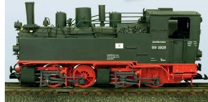
Die Abbildung zeigt unser Handmuster der HSB 99 5901.