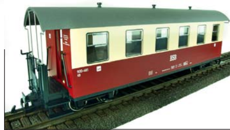
HSB Personenwagen 900-481