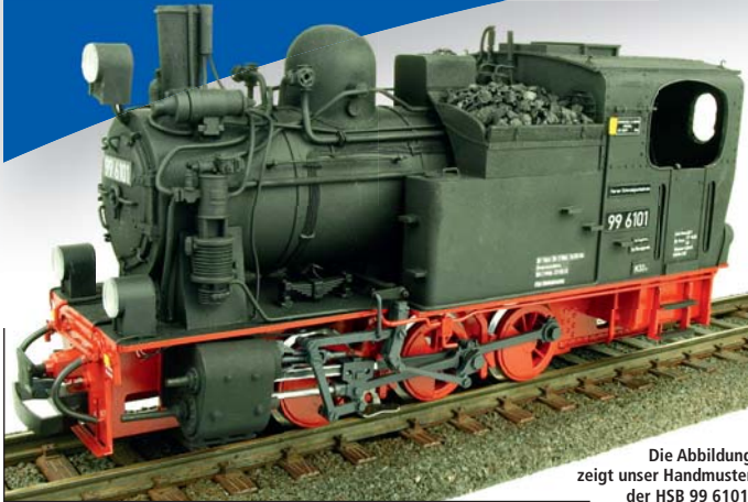
Die Abbildung zeigt unser Handmuster der HSB 99 6101.

Das Modell der HSB Dampflokomotive 99 6101 werden wir passend zum 100-jährigen Jubiläum