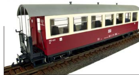
HSB Personenwagen 900-433