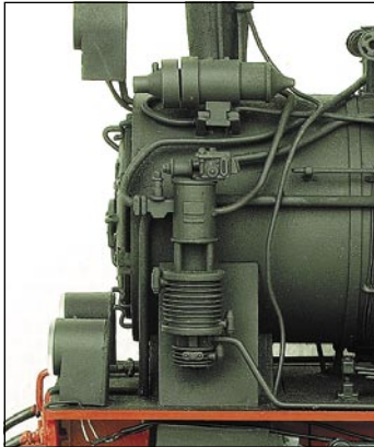
2012001 HSB C-Kuppler 99 6101