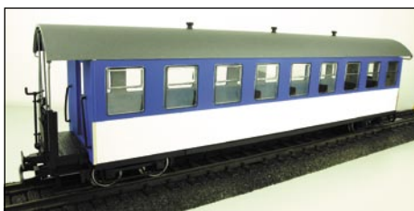
3330700 DB Autozug Wangerooge ohne Werbebotschaft

Der Flachwagen mit zwei Drehgestellen hat Metallachsen und ist universell einsetzbar. Das Fahrzeug ist beidseitig mit einer Bühne ausgestattet.