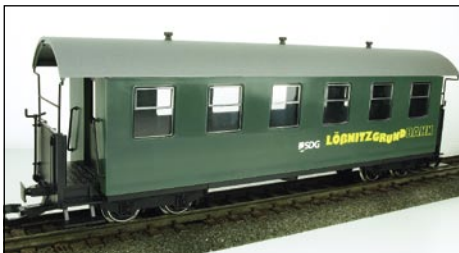
3951740 DR Personenwagen 970-407 „Lößnitzgrundbahn“