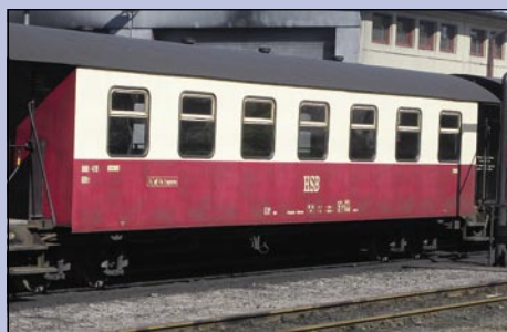
3530771 HSB Personenwagen 7-Fenster 900-476 NEW MOLD

Die Harzer Schmalspurbahnen GmbH unterhält einen Traditionszug (oder auch „Oldtimerzug“ genannt). Diese Fahrzeuge gehören in den Zugverband und werden im Sonderzugverkehr von der Mallet 99 5902 gezogen.