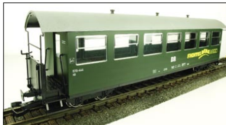
3941740 DR Personenwagen 970-387 „Fichtelbergbahn“