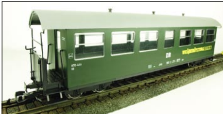
3950720 DR Personenwagen 970-589 „Lößnitzgrundbahn“