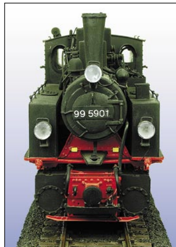
2011001 HSB Mallet 99 5901

Das Train Line-Modell ist maßstäblich korrekt umgesetzt und wird mit zwei zugstarken Bühlermotoren ausgestattet sein. Ein Haftreifen sorgt für eine außerordentliche Zugkraft. Der typische Kohlekasten aus Holz wird nachgebildet. Das Modell erhält die authentische grüne Lackierung.