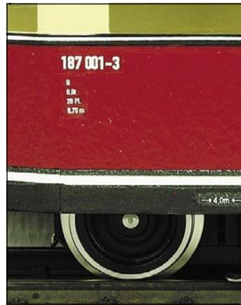
2030000 HSB Triebwagen T1