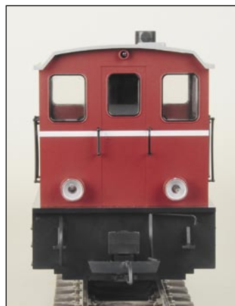
2021000 Deutz Diesellok V3