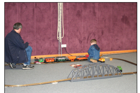
Ein LGB-Rundkurs für die Kids.