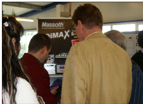
Der von Interessenten stets umlagerte Massoth-Stand im 1.OG.