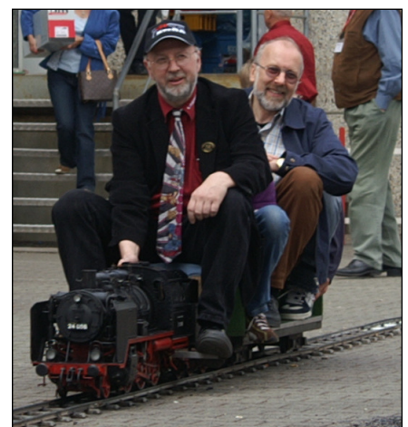
Vorstand Alt und Neu auf gemeinsamer Fahrt anlässlich des diesjährigen Jahrestreffens.