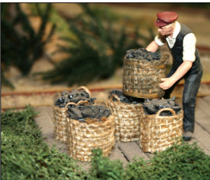
Liebevoll gestaltetes nettes Anlagendetail.