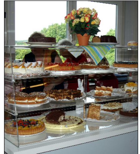
"Ausschnitt" aus dem reichhaltigen Kuchenbuffet in der Cafeteria.